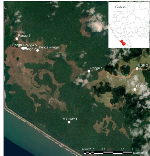
Carte. Sites archéologiques de Panga

L'autorité compétente doit, dans le délai de trente jours à compter de la déclaration de l'article visé 35 ci-dessus, notifier la suspension provisoire des travaux et les mesures de sauvetages à entreprendre (Journal Officiel de la République Gabonaise, 1994, p. 278).